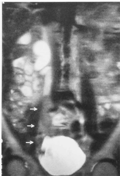
Fig. 1. MR-urography showed right hydronephroureter and the filling defect of the right lower ureter.

ら下部尿管は low intensity を示した。左腎尿管には異常を認めなかった (Fig. 1)。右逆行性尿管造影では尿管下部は直径 15 mm に拡張し、腫瘍によると思われる陰影欠損を認めた。膀胱鏡検査において膀胱内には腫瘍を認めず、両側尿管口にも異常はなかった。MRI (T2 強調画像) では、high intensity を示す拡張した右尿管は仙腸関節部分でモザイク状となり、傍膀胱部まで続いた。以上より右尿管腫瘍の診断のもと 2002年 1月25日手術を施行した。