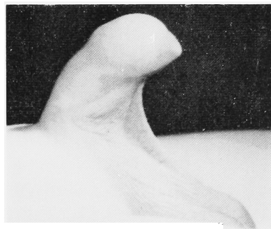
Fig. 2. 側面像. 陰囊皮膚が水かき (web) のようにみえる.