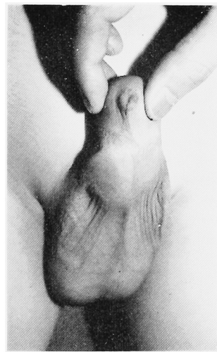
Fig. 1. 正面像.

尿道下裂を伴わない Webbed penis はまれで、英文文献でも10数例の報告 4-9) があるのみである。尿道下裂以外には合指症 7) 。全身重症奇形 10) に伴ったものが報告されている。尿道下裂を伴わない Webbed penis の治療は種々の形成外科的手法によってなされるが、本症例は Webbed penis の程度が軽かったため、背面切開術のみで陰茎の形を整えることが可能であった。治療の際、はじめに環状切除術を施行してしまうと、陰茎腹側の皮膚がたりなくなってしまうので