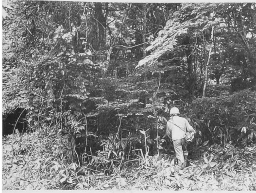
放置された山林を買い増して、手入れをする。左ペー ジは手入れ後のアフアンの森。