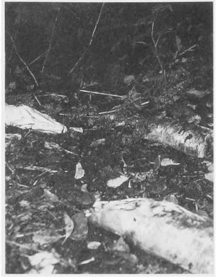
川でサケを獲ったクマは、森の中に持って行って喰べる。少しだけ喰べて放って置かれたサケは、海の栄養を森に撒いているのと同じ。

も大きいと。クマは、頑固な釣り人と同じように、自分の場所があるんですね、サケを捕る場所。そこに、ほかのクマが来ると怒るんです。でも、サケをくわえているから、ほかのクマを噛んで追っ払うことができないんです。くわえているか、押さえているんですよ、捕ったサケを。