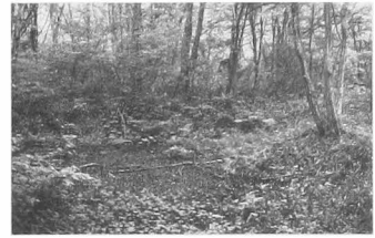
溝を掘り、小さな池も作った。土手を上げて水が溜まると、地中の水位が下がり、木の根が呼吸できるようになる。上の写真は工事前、左は工事後。

りました。土手を上げて水が溜まると、地中の水位が一メートル半から二メートル落も下がりました。土手の上には、十二種類の木を植えました。全部、落葉樹です。この溝は、実は、川なのです。われわれは川をつくったわけです。ふつう、どこから川の水をひくと、すぐに日本の田舎の、水利権がどうのこうのと、うるさい田舎の爺さまたちが集まってくるのですよね。でも、われわれは川そのものをつくったのです。