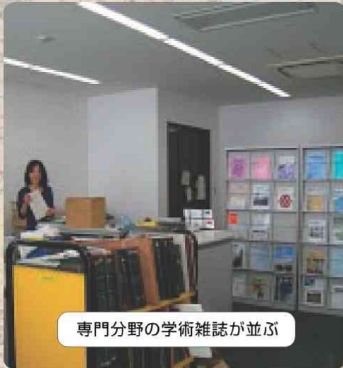
専門分野の学術雑誌が並び

桂キャンパスと他のキャンパス間は連絡バスが運行されています。吉田キャンパスから桂キャンパスに行く場合は、正門横のバス停からご乗車ください。