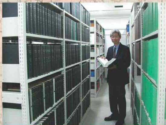
電気系図書室にて