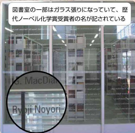
図書室の一部はガラス張りになっていて、歴代ノーベル化学賞受賞者の名が記されている