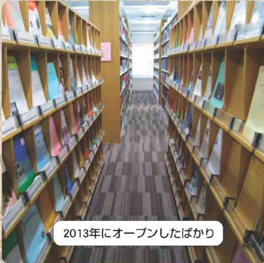
2013年にオープンしたばかり