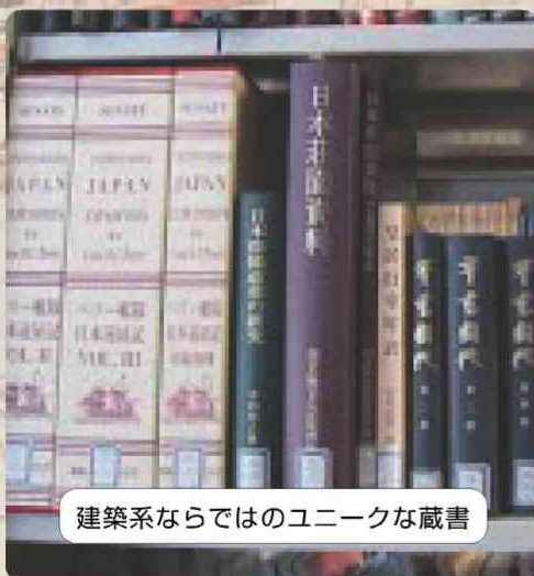
建築系ならではのユニークな蔵書