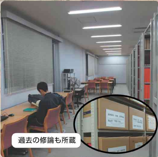
過去の修論も所蔵