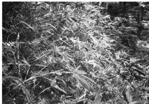
Fig-2 ブナ林内のネマガリダケ Sasa senanensis in Fagus forest. plot no. 4-4