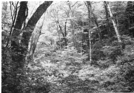
Fig-4 谷のブナ林におけるブナークロモジ群集 Lindereto-Fagetum crenatae on the lower part of the side. plot no. 4-1