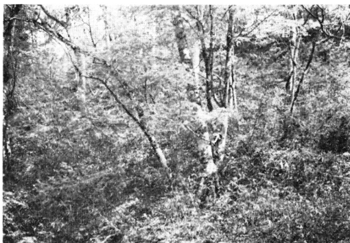
Fig-1 ブナーネマガリダケ群集 Saseto-Fagetum crenatae plot no. 5-6