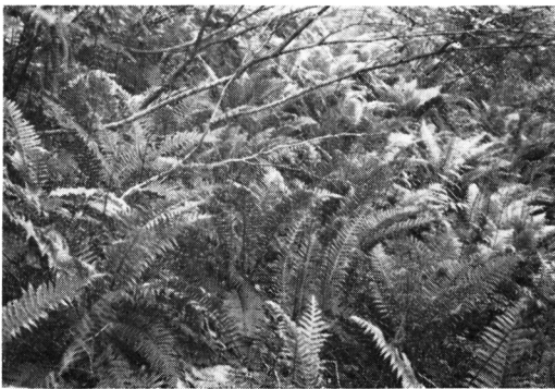
Fig-6 ブナ林内のヤマソテツ Plagiogyria Matsumureana in Fagus forest. plot no. 4-1