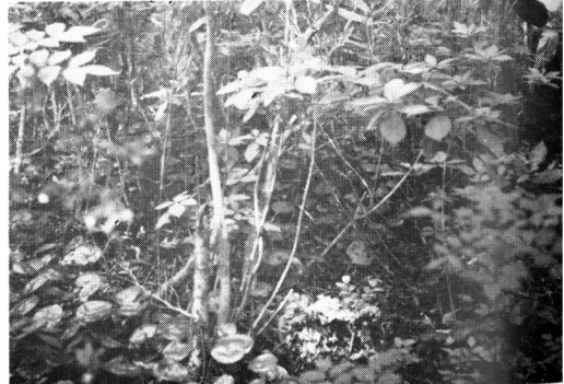
Fig-10 2次林におけるリヨウブ Clethra barbinervis in the secondary forest. plot no. 20-3