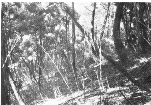
Fig-3 尾根のブナ林内で一斉に枯れたネマガリダケ Dead Sasa senanensis in Fagus forest on the ridge. plot no. 24-3