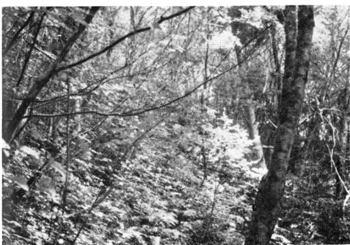
Fig-5 ブナ林内のクロモジ Linderella umbellata in Fagus forest. plot no. 1-3