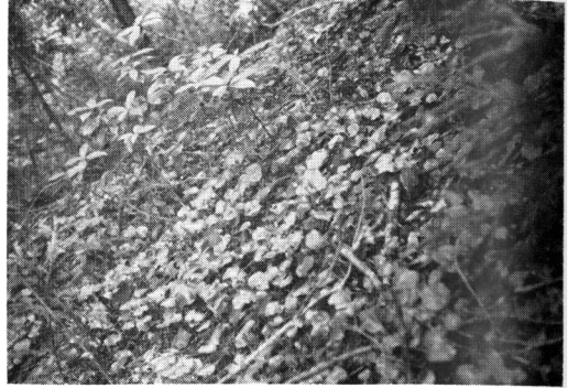
Fig-8 同左の下層のイワウチワ Shortia uniflora growing as an undergrowth of ditto. plot no. 10-3