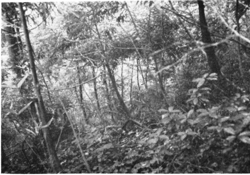
Fig-7 ブナ林における伏条性スギ Creeping sprout of Csyptomeria japonica in the shrub layer of Fagus forest. Plot no. 10-3