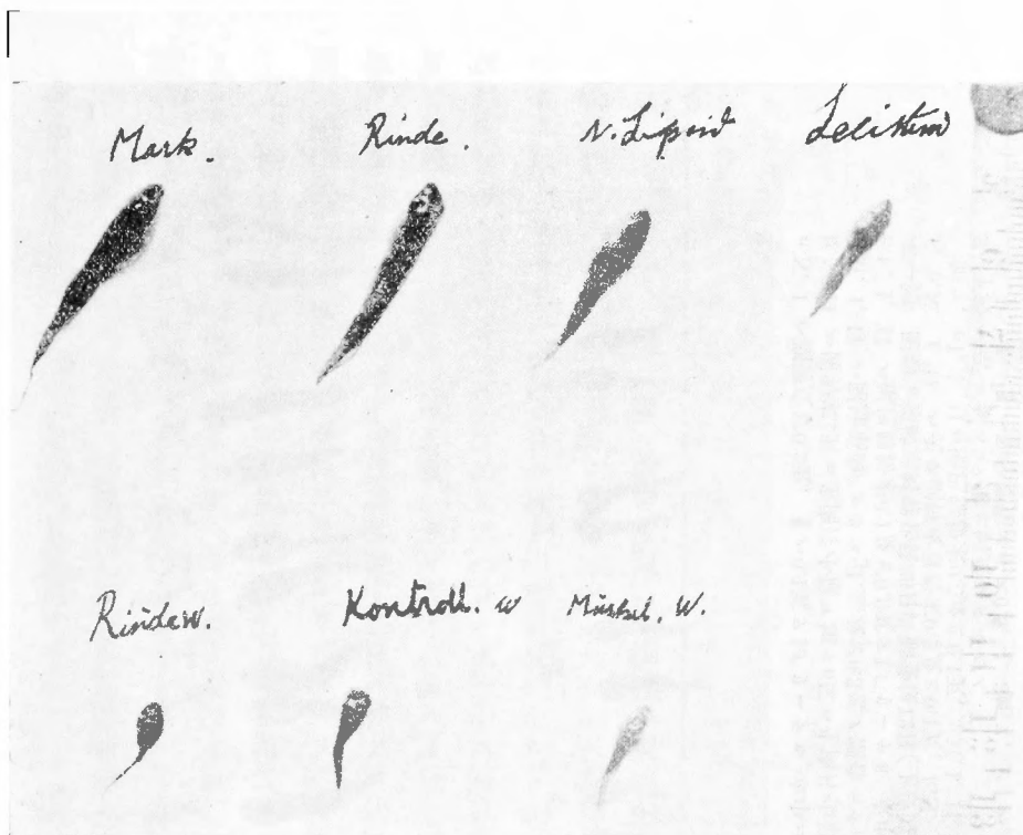
第二圖 副腎皮質 (Rinde) 髓質 (Mark) ハ夫々粉末ヲ0.1瓦及ビ N. Lipoid ハ皮質中ヨリ「エーテル」ヲ以テ抽出セルモノヲ1「リートル」中ニ加フ、前者ハ4週日飼養、後者ハ6週間飼養、(上段) Rindew. Kontroll. Muskel. W. ハ夫々副腎皮質及ビ筋肉「エキス」ヲ以テ50日間飼養後撮影(何レモ同胞)