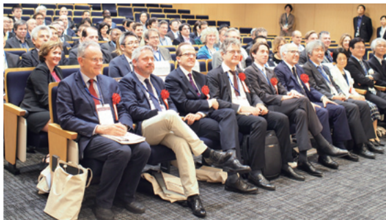
京都一ボルドー シンポジウム2015

また、地域中核病院や自治体との連携の強化および海外特にアジア地域の病院との医療人材交流の一層の拡大を通じて、地域のみならずアジア諸国における国際標準の医療の提供を図ります。