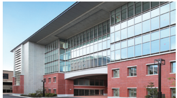
国際科学イノベーション棟