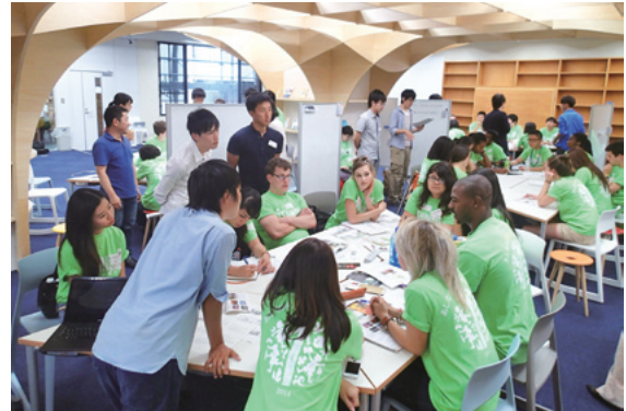
あしなが育英会「京都学インターンシップ・プログラム」