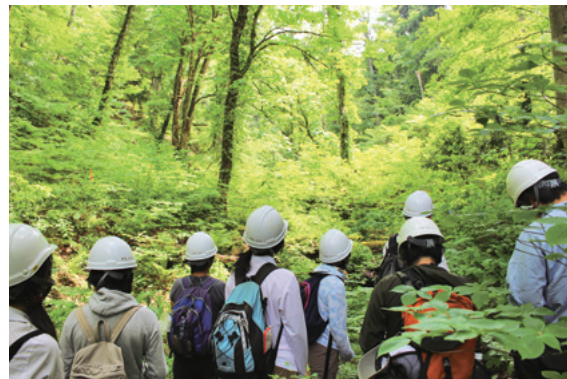
芦生研究林「教育・研究利用現地ツアー」