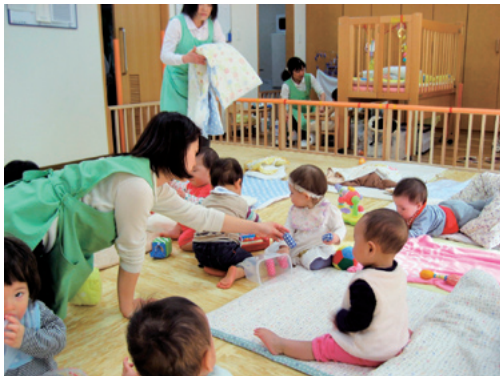
男女共同参画推進センター 保育園入園待機乳児保育室

②男女の安定的な共同参画を実行するため、将来のキャリアパスについて希望を募り、海外の事例を参照しつつ、男女が快適に共同で仕事を進めるために必要な意識改革や環境整備を実施していきます。