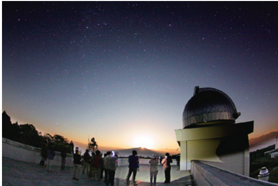
市民を対象とした「飛騨天文台 自然再発見ツアー」

②様々な背景をもつ学生が、不安なく本学で教育研究に専念できるよう、カウンセリング、キャリアサポートや障害学生支援において、学生のニーズに対応した総合的な学生支援の充実を図ります。また、教育面での学生支援等については、EM(Enrollment Management)の活用や、留学生が利用しやすい英語による情報提供などにより、支援効果を高めます。