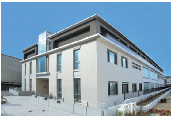
博士課程教育リーディングプログラムの拠点の一つとして整備した「京都大学東一条館」