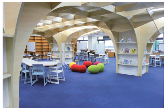
グループワークやディスカッション等が可能なスペース「ラーニング・commons」(附属図書館)