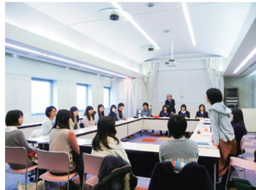
女子高生・車座フォーラム