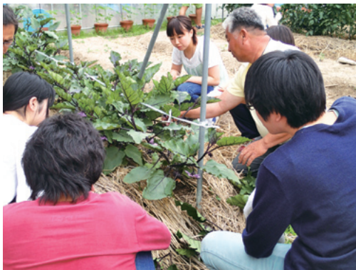
全学共通科目「京野菜の栽培を習う」での実習