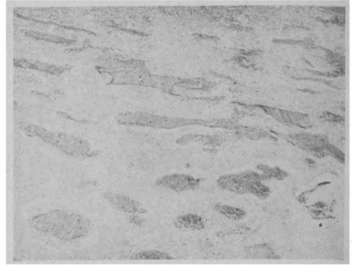
Fig. 2 Microscopic Features

断するに、被蓋にて左右両側殊に左側に広く黒褐色に変色せる部分あり。上方は第3脳室の後端、下方は第4脳室の先端に及ぶ。顕微鏡標本により血管腫の所見を得。（第1、2図）