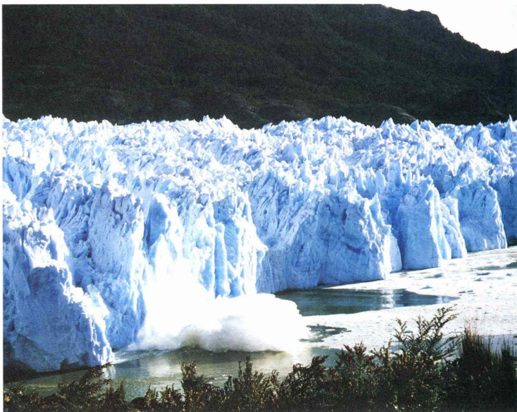
南米パタゴニア北氷陸から西に流れ落ちるサンラファエル氷河の末端 —関連記事本文 632 ページ— (氷河は1日15mぐらいの速度で前進し 高さ100m近くもある) (末端が湖に崩れ落ちる)