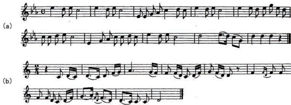
図2.1: (a)陰音階の譜例と (b)陽音階の譜例

出版されている。しかし、日本民謡を計量的に分析するためには、データ量が豊富であり、かつ、一定水準以上の質が保たれている必要がある。その点で『日本民謡大観』に掲載された楽曲は、全国的規模のデータ量として申し分がなく、かつ、日本民謡に関する高い知識をもった採譜者や校正者が資料を丹念に選別していることから、音楽学者の小島美子氏は「現状で最も信頼のおける日本音楽の資料」と評している(小島1992)。