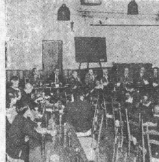
稀にみる活氣 座談會學生生活の語り

座談會學生生活の語りは、學生の生活の現状と、その悩みを語り合ふ機会を提供する。これは、學生の生活の改善と、その悩みを解決するためである。