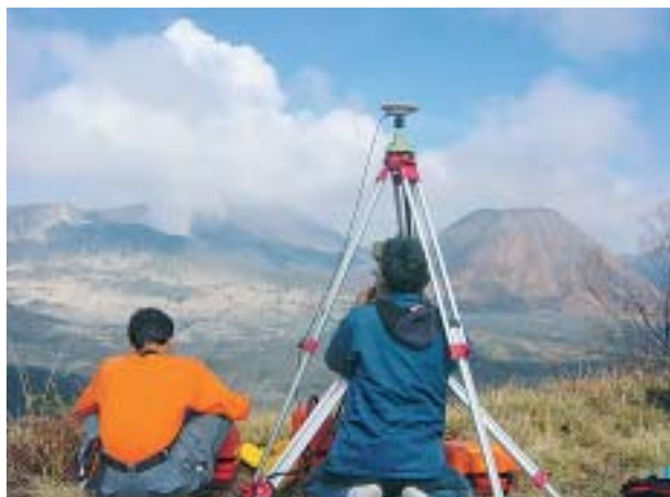
噴火後、緊急に行われたGPSおよび光波測距儀による火山体の地盤変動観測。前方に白色の噴煙をあげるプロモ山が見える。