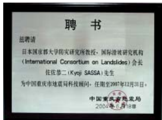
重慶市地震局科学技術顧問委嘱状のため

また重慶には多数の活断層の存在が知られており、貯水池湛水による地震活動が活発になると予想されているため、地震予知研究および耐震技術における共同研究の推進も期待されている。