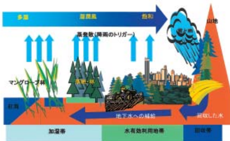
図2 海洋性砂漠における水循環型オアシス・ネットワーク

限られた水資源の効率的利用と再利用に基づく快適な生活空間や高い生物生産を有する環境への改善を目的とした「水循環型オアシス・ネットワーク」の概要を図2に示す。加湿帯を設け有効な蒸発散を