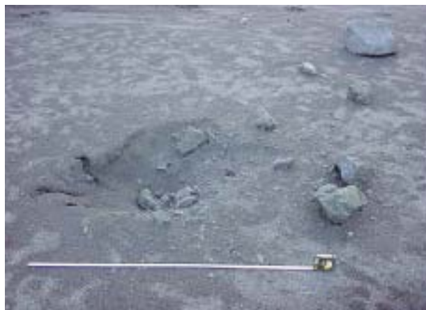
火口から約1kmの距離まで到達した噴石。噴石落下により約50cmの大きさの穴があいた。

今回の噴火は少量のマグマを含むマグマ水蒸気爆発と考えられ、噴煙の高度、噴火の継続時間をみても決して大きな噴火とはいえない。しかしながら、火口付近に多くの観光客が立ち入る火山では小規模な噴火といえども極めて危険であり、今回のプロモ火山の噴火はこのことを改めて実証することとなった。わが国の阿蘇山のケースと極めてよく似ている。多くの観光客が立ち入ることを考えると噴火予知の必要性はいうまでもないが、このような小規模な噴火に対して有効な噴火予知を行うことは、プロモ火山の場合、不安定な地震観測システムと一人だけの観測員であることを差し引いても、かなり難しいと思われる。今回の場合、小振幅の火山性微動の発生以外、火山性地震の発生などはほとんどみられなかった。唯一噴火発生予測の鍵となる現象は、噴火の