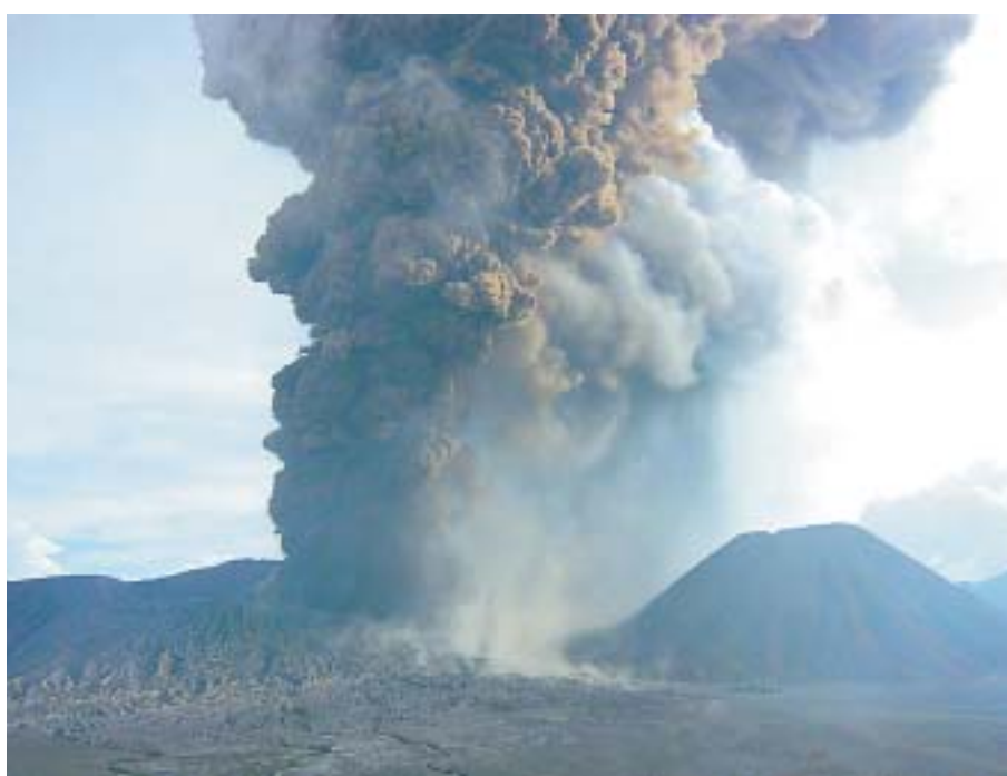
ブromo火山の2004年6月8日の噴火（噴火発生の約5分後）