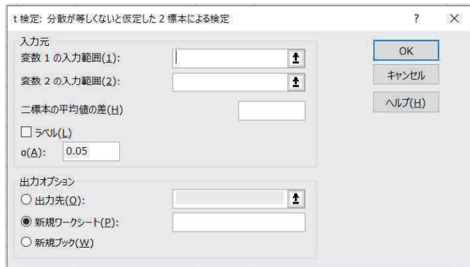
図 2: 「t 検定」ウィンドウ