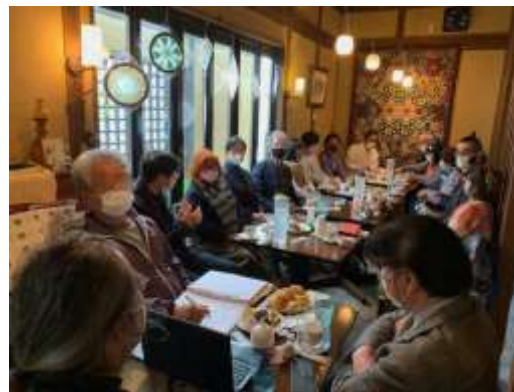
Fig. 14-2 Yama's café in Higashi-Miyoshi

the contemporary place of the Emperor and royal family in Japan – the predominant response was that this has never been discussed by the participants – this leads to the question of how has the narrative of the Emperor in Japan evolved in the past 50 years? b) observing families camping near the river to enjoy the cherry blossoms and my reflections on the importance of that ritual of social connection in reflecting on nature, and c) viewing the 1000 year old camphor tree that is a symbol that embodies a sense of community pride in its and the community's resilience.