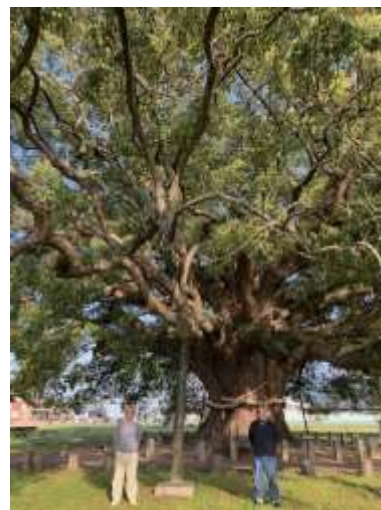
Fig. 14-3 Under the ancient camphor tree