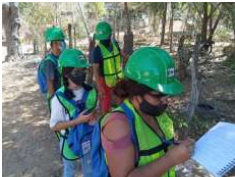
Fig. 4-1 Safety map making

2020年度にサルコ通信制中学校で行われた活動は、まち歩き、防災マップ作成、そして地域住民に対する過去の災害体験のインタビューである（Fig. 4-1）。これらの活動の事前授業として中野が日本からリアルタイムオンライン授業を行うなど、通信制学校の利点を生かしたリモート防災教育も取り入れた。このように、これまでのSATREPSプロジェクトの成果が、シワタネホに定着しつつある。2021年度は、サルコ通信制中学校と日本の中学校との地震・津波防災オンライン交流を実施予定である。