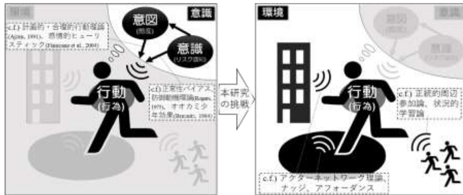
Fig.13-2. Toward the “environment” based disaster preparedness from the “perception” based disaster preparedness

合理的行動理論・防護動機理論などの既存の理論との整合性を検討した上で、環境に関する諸理論 (e.g., アフォーダンス, ナッジ, ANT) を援用し解釈することを検討している。災害弱者を包摂した防災を達成するために、「防災意識が高まれば行動が促される」という従来の枠組みを抜本的に見直し、防災行動が取れない環境要因を根本的・包括的に把握した「防災環境論」を構築を目指している (Fig.13-2)。