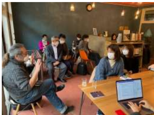
Fig. 14-1 Yama's café discussion

This was my second trip to Chizu with Prof. Norio Okada, who has worked with community members for more than three decades to slowly and incrementally build their resilience. My first trip was in October 2017. When a group of us from DPRI visited in 2021, the changes in the community on many levels impressed me. Not only was an old building undergoing reconstruction as a new facility for visitor accommodation, but a new restaurant/café, and meeting space for the community was operating. This latter facility was the venue for a lively evening meeting I attended. It brought together a variety of people for presentations and discussion of community issues. Four entrepreneurial women from Chizu presented their vision and plans for improving facilities and related programs to bolster Chizu's visibility and financial base. In doing this, they express a narrative of their vision for the future and a narrative of social identity as women leaders in the rural community.