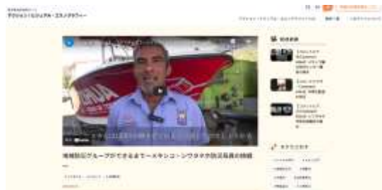
Fig. 4-2 “Action! Visual Ethnography” Website ( https://www.tesoro.rcep.dpri.kyoto-u.ac.jp/visual ethnography/ )

同映像教材を視聴する人々に対して防災教育や地域防災に取り組む姿勢を喚起しやすく、水平展開へとつながりやすい。しかし、アクションリサーチの表現として留意すべき点は、この映像教材は研究者が編集をしているのであるから、あくまでも研究者の視点に基づく2016年から2020年までの見方・ストーリーであり、その意味でアクションリサーチの評価・表現は研究者によって占有されてしまっている、ということである。すなわち、本来あるはずの共同当事者（たとえばシワタネホ市防災局職員）の見方・ストーリーが、この映像教材には反映されていない。そこで、共同当事者と同映像教材とともに視聴し、2016年から2020年までの変化を共同当事者の言葉で語ってもらうことを通して、共同当事者らの見方・ストーリーを表現するコメントビデオも制作した。このインタビューでは、共同当事者視点の防災教育推進の工夫、苦勞、失敗、改善について語られており、7編の映像教材を多様に表現する重要な防災教育プログラムの構成要素とした。さらに、これら一連の映像作品を防災教育プログラムとして実装するためのウェブサイトの構築を行い、「アクション! ビジュアル・エスノグラフィー」ウェブサイトと名付けた（Fig. 4-2）。映像およびウェブサイトはスペイン語、英語、日本語の3か国語で制作されている。