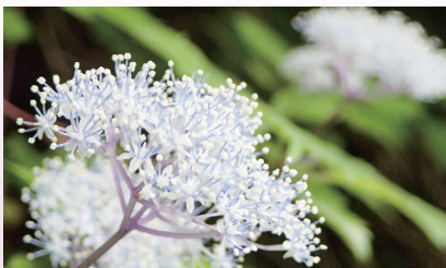
コアジサイ （芦生研究林）