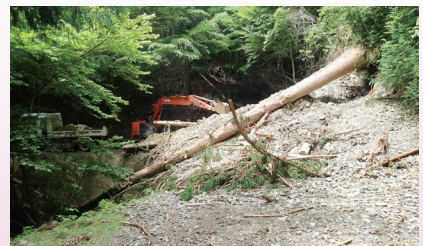
6月の大雨で発生した土砂崩れの復旧作業 （和歌山研究林）