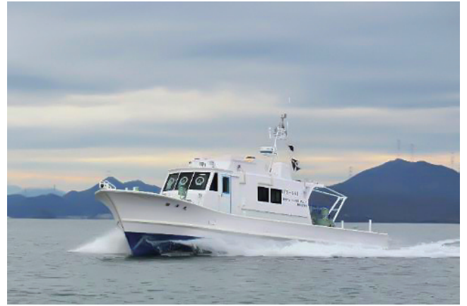
教育研究船「緑洋丸」

今後とも、日本海という豊かなフィールドでの船舶関連業務を通じて、教育研究活動の支援および地域との関わりを大切にして参ります。