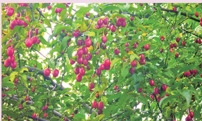
トウグミの実 （北白川試験地）