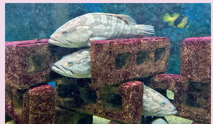
仲良く整列したクエ （瀬戸臨海実験所）

https://fserc.kyoto-u.ac.jp/zp/nl/news61