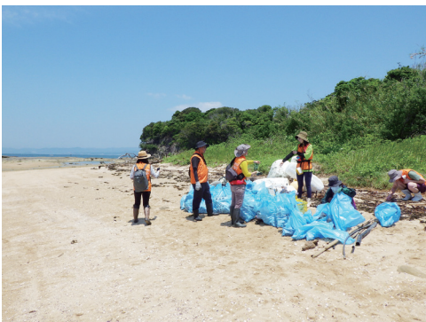
島島ビーチクリーン活動の参加者と収集したゴミ

4年間のプロジェクトでは、和歌山県白浜町にある瀬戸臨海実験所、京都府舞鶴市にある舞鶴水産実験所、京都市にある上賀茂試験地を主たるフィールドとして、2023年3月から地域の方々と連携する活動が実施されています。