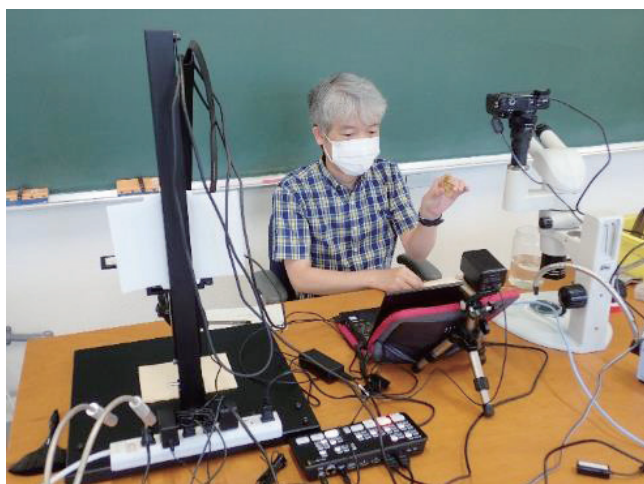
オンライン実習配信の様子

り、2020年には全世界で猛威をふるいました。瀬戸臨海実験所では、コロナ禍前の2019年度に京都大学の実習10件延べ人数300人、公開臨海実習4件延べ130人を受け入れていたところ、2020年度には京都大学の実習3件延べ人数30人、公開臨海実習1件15人にまで落ち込みました。感染者数のピークは第1波から第8波まででありました。第1波から第3波までの全ての実習を中止にしました。その後、対面実習では日程の短縮と参加人数制限を行った他、様々な感染拡大防止の工夫を行いました。第4波中に理学部臨海実習第3部を行いました。しかし、宿泊に伴う感染リスクを避けるために当実験所での実施を断念し、実習材料を本学理学部に運び込んで実習を行いました。第5波中の理学部臨海実習第1部と第2部は、日程短縮の上、オンラインで行いました。前もって実習生に標本（甲殻類、貝類、ウニ類等）、ピンセット、解剖ハサミを送付し、オンラインでPC、カメラ、実体顕微鏡の画面を共有して同定方法や解剖の手順等を解説しました。