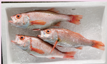
京都府で9月に底曳網が解禁 アカムツ （舞鶴水産実験所）