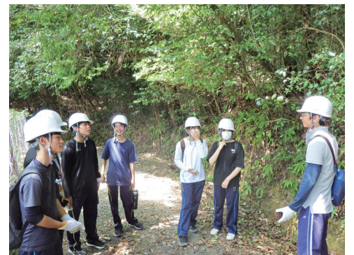
上賀茂試験地での里山体験プログラムづくり

このプロジェクトでは、森里海の連環を研究することに加えて、上記のような地域社会との連携活動を行いながら、参加