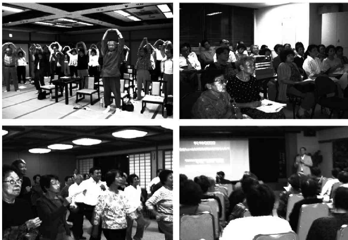
図3 “すこやか健康講座”の一場面

以上のような状況を鑑み、我々は2005年度から京都商店連盟等と協働し京都市および宇治市の商店街を拠点に出前“すこやか健康講座”を実施している。同講座は、当初古川町商店街をモデル地区として始め、