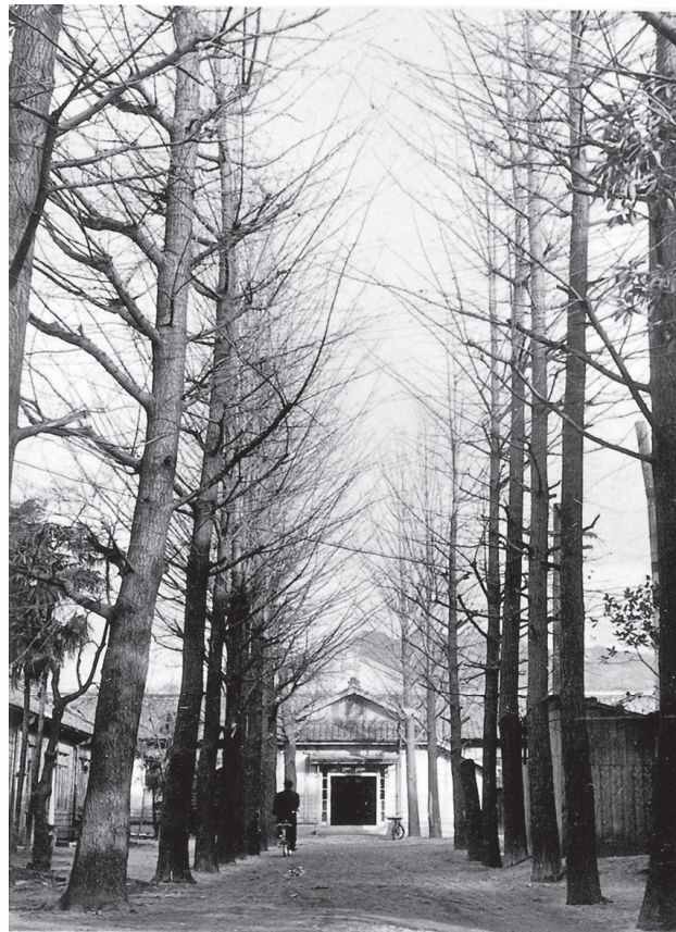
吉田寮入口の銀杏並木（1950年ごろ）

吉田寮は1913（大正2）年2月に完成。全室個室を採用するなど、当時の学生寄宿舍としては全国随一の設備を誇った（関連記事5ページ）。現在使用されている国立大学の学生寮の中で、最も古い建築物である。