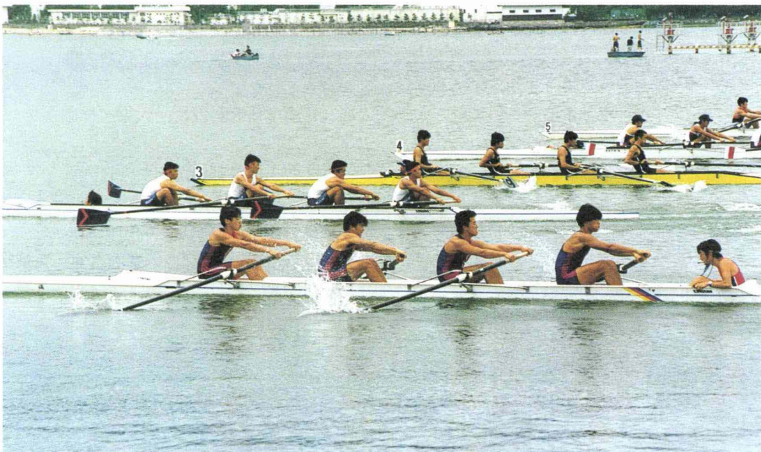
平成10年度関西選手権で力漕する対校舵手付きフォアクルー (手前が京大のクルー)

ここを拠点として、60名を超える部員たちが、ボート競技の華、エイトでの悲願達成に向けて日々練習に励んでおり、毎年、全国制覇を目指して果敢に挑戦を続けている。