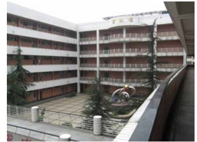
《 騒動当日の様子 》 《 4月初旬の様子 》

私が4月に入って眉山第一中学を訪ねたとき、学校は平静を取り戻しており、多くの高校生たちは一生懸命勉強していた。この事件は中国の一人っ子をめぐる教育の過熱状態が、四川省の片田舎の一都市にまで及んでいることを示している。また高校生といえどもフラストレーションが高じ、それに火がつくと理性で制御できない大きな騒動に広がる可能性があるということを証明している。