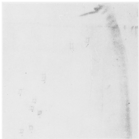
Fig. 4. Chromatography. Free amino acids in renal medulla (normal renal medulla of rabbit. No. 5.).