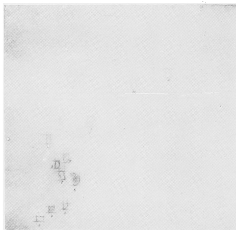
Fig. 5. Chromatography. Free amino acids in tuberculous cavity (tuberculous kidney of rabbit. No. 1.).