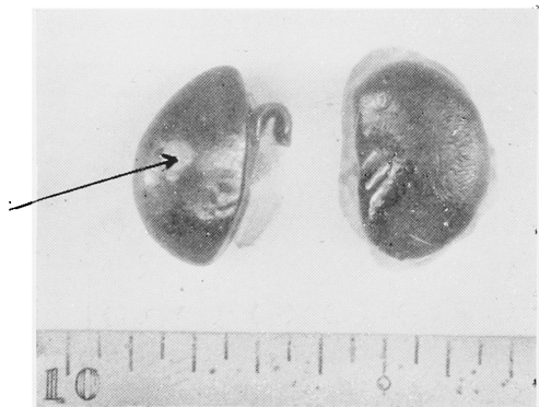
Fig. 1. Surface of kidney (rabbit).