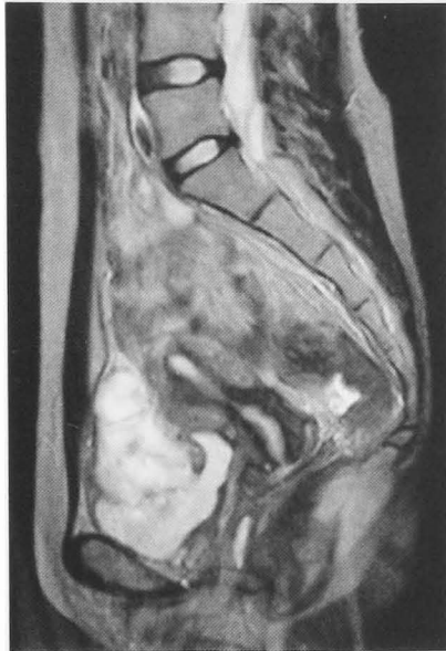
Fig. 1. MRI (T2-weighted image) demonstrated a tumor extending from umbilicus to the bladder dome.