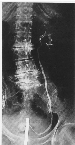
Fig. 1. Retrograde pyelography showed an irregular filling defect in the left renal pelvis.

Moertel らは癌患者から異時性に第2癌の発生した例は2.8%であるのに対し、これらからさらに第3癌の発生率が5.0%、さらにこのうち第4の癌の発生率が5.8%と次第に上昇していると報告している 2) 。また、泌尿器科領域の患者は重複癌の発生頻度が高い傾向にあるとされ 7) 、本症例を含めた重複癌の患者には、さらなる重複癌の合併を念頭に置いた経過観察が