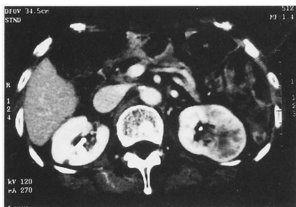
Fig. 2. Abdominal CT scan revealed a mass occupying the left renal pelvis.