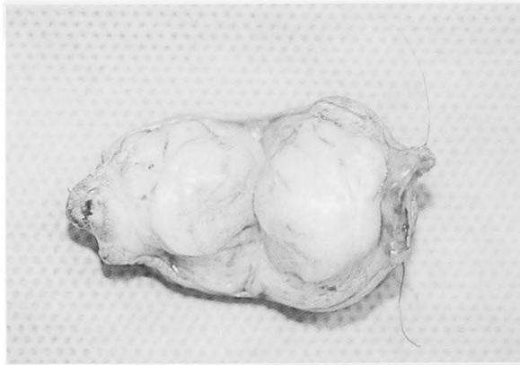
Fig. 2. Cross section of the specimen. The tumor was elastic firm and 30.0×20.0×18.5 mm in size.