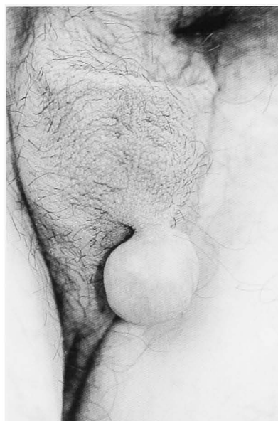
Fig. 1. Pedunculated tumor was arising from the left scrotum.

初診時現症: 陰嚢左側下極に菲薄な皮膚に覆われた直径 30.0 mm, 有茎性, 弾性硬の球状腫瘤を認めた (Fig. 1)。超音波検査では腫瘤は径 20.0×23.5 mm, 内部エコーは hypoechoic, heterogenous であった。腫瘤は精巣, 精巣上体, 精索とは無関係に存在していた。血液検査, 尿検査は異常を認めなかった。