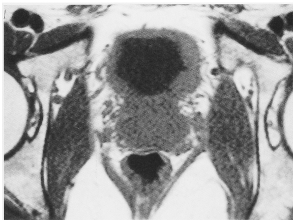
Fig. 2. MRI shows thickening of the bladder wall.

拡張し、麻酔下での膀胱容量は 250 ml から 350 ml まで増加した。術後 3 日目に尿道バルーンカテーテルを抜去した。排尿時痛は消失し排尿頻度は 3 時間に 1 回、1 回排尿量は 100~200 ml と症状の改善を認めた。現在術後 5 カ月経過しているが、排尿時痛なく排尿頻度は 2 時間に 1 回、1 回排尿量は約 100 ml である。