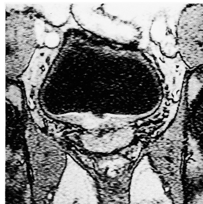
Fig. 1. MRI showed the tumor in the right wall of the urinary bladder.