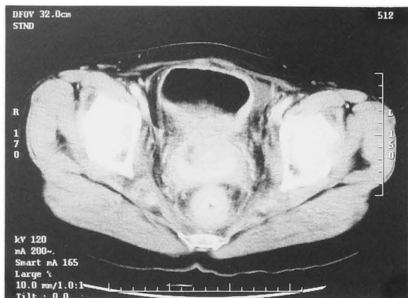
Fig. 1. The entire bladder wall is thickened but most of the thickening is in the posterior wall.

側尿管の狭窄部は膀胱進入部であった。後壁を中心に膀胱壁は著明に肥厚しており、腔壁との境界は不明となっていた。両側腸骨リンパ節の腫大を認めた (Fig. 1)。