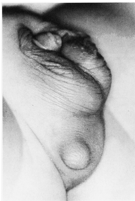
Fig. 2. The right side of accessory scrotum is circumscribed by the raphe which was normal in position at the penis and the anterior scrotum.