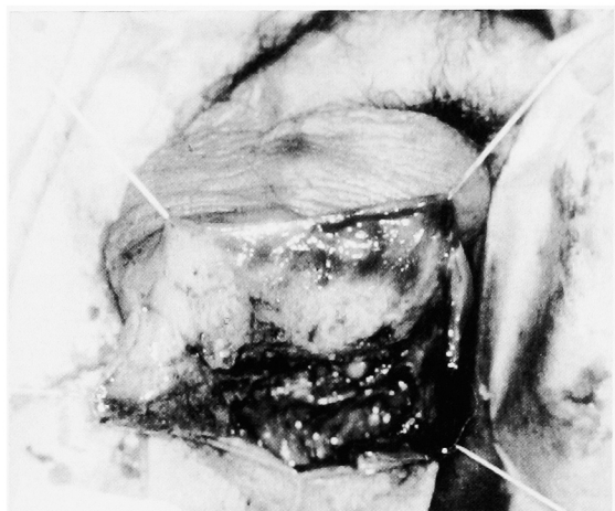
Fig. 2. Debridement

coccus sp. と同定された。術後は嚴重な血糖値管理のもと、抗菌剤の投与、およびポピドンヨードによる頻回の洗浄を行った。