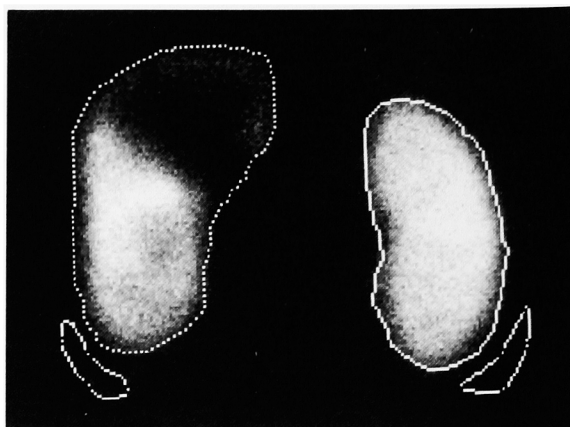
Fig. 3. Renal scintigram with ^{99m}\text{Tc-DMSA} revealed decreased but slight uptake in the upper half of the left kidney.

以上より画像診断と内視鏡検査所見から左完全重複腎盂尿管、陰前庭部異所開口尿管と診断した。問題となる左上腎機能は、腎シンチグラムおよび尿管内の尿