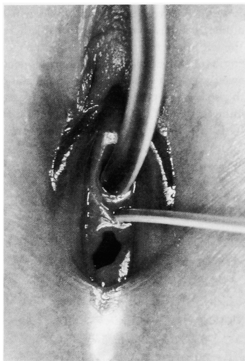
Fig. 4. Site of ectopic ureteral orifice in the vestibulum is indicated by ureteral catheter.

化学成績より腎保存は可能であると判断し、同一麻酔下で尿管膀胱新吻合術を施行することとした。