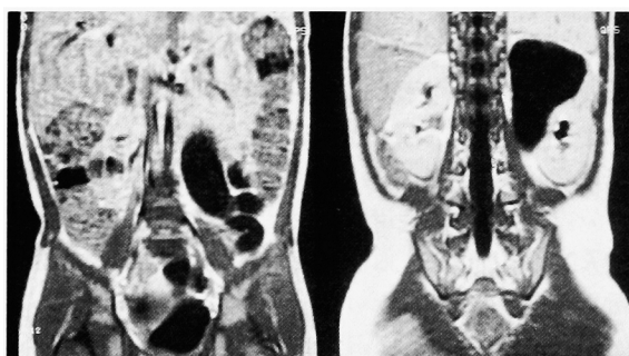
Fig. 2. MRI demonstrated hydroureteronephrosis of the upper half of the left kidney and ureter.

外陰部を注意深く観察すると、陰前庭部の外尿道口6時の位置に小さな開口部を見つけ、同部より3.5Fr. feeding tube を挿入したところ尿が採取された (Fig. 4)。尿電解質は、Na55, K18, Cl155 mEq/lであった。左膀胱三角部は全体に隆起していた。左尿管口は正常部位に1個認め、形状は stadium 型であり、右尿管口は正常であった。また尿道に異常は認めなかった。