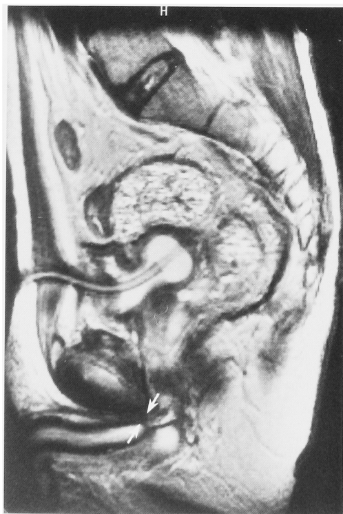
Fig. 2. Case 5. T2-weighted sagittal image. Arrow: obstructive lesion after disruption.

初回入院時の手術回数は尿道再建術も含め1回から4回 (平均2.4回) であった。尿道再建術後バルーンカテーテル抜去までの日数は12日から15日 (平均13.8日) であった。5例全例が術後自排尿可能となったが、全例に内尿道切開術、ブジーなどの補助療法を要した。症例3および4は退院後尿道狭窄により内尿道切開術を要した (Fig. 3)。