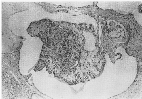
Fig. 1. Ectatic efferent ducts and microcysts filled with papillary processes are seen. (H.E. ×200)

本症は von Hippel-Lindau 病を高率に合併するといわれているため術後ではあるがその検索を行った. まず眼底所見は正常で, 腹部 CT では肝, 脾に腫瘍, 嚢胞はみられず右腎において直径約 1 cm の小さな孤立性嚢胞が腎門部にみられただけであった. 頭部 CT では小脳腫瘍の存在は認められなかった. 以