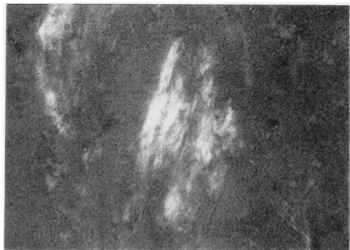
Fig. 3. In Congo red stain under polarized light microscope, green birefringence was observed. ( \times 200 )

脾、腎は触知しない。外陰部には異常を認めず。表在リンパ節は触知せず。神経学的な異常および皮膚病変も認めなかった。