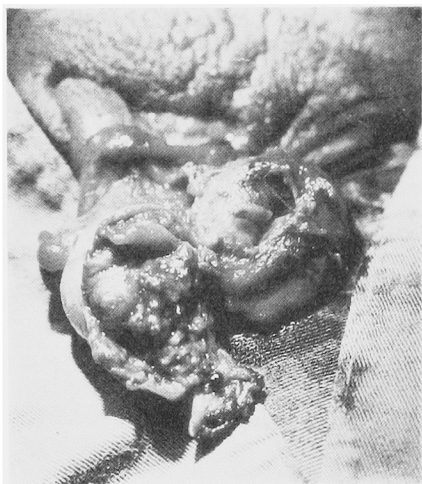
Fig. 1. The necrotic part was removed and 2/3 of testis was repaired.