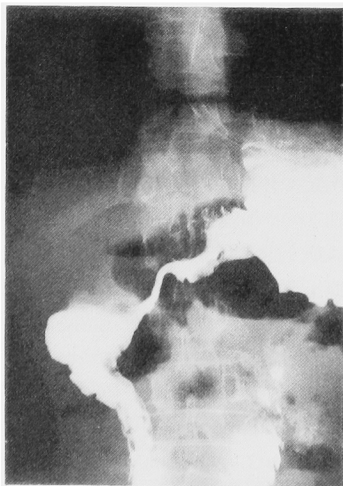
Fig. 2. 胃体部から幽門部にかけて壁の不整と内腔の狭小化を認める。

られ (Fig. 2)，胃癌と診断され，さらに全身的検索を行ったがほかに腫瘍は認められず精索部腫瘍は胃癌からの転移と推定された。術後3週頃より急激に著しい貧血，嘔吐，腹水貯留をきたし，1988年1月12日死亡した。