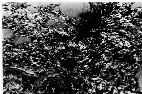
Fig. 3. Microscopic examination in Congo Red stain under polarized light microscope (×200)

入院時より経口抗生物質を投与していたが、8月5日頃より排尿時痛、血尿が消失しはじめ、8月11日の尿検査では異常が認められなかった。8月13日に膀胱鏡を行ったところ粘膜全体が赤色調を帯びた以外著変は認められず、生検を行ったところ病理組織学的には粘膜下にびまん性にエオジン好性の無構造な物質がみられ、コンゴレッド染色を行うと赤紅色に染まり、膀胱アミロイドーシスの診断であった (Fig. 2, 3)。