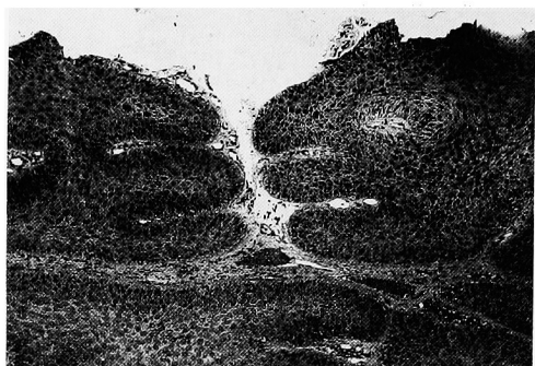
Fig. 2. Microscopic findings of the biopsied specimen (H.E staining; ×50)

HSV 1 IgM (FA) 10×未満, クラミジアトロコマ ティス IgG 抗体 40×未満, HIV (HTLV-3) 抗体 (EIA 法) 陰性. 尿沈査: 蛋白 (-), 赤血球 (-), 白血球 (-), 細菌 (-).