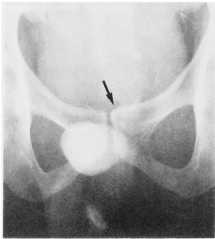
Fig. 1. Vesiculography