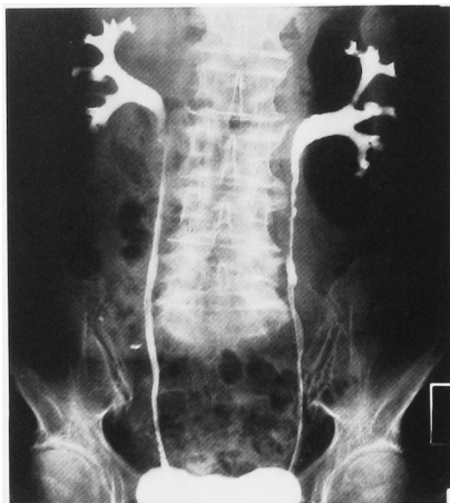
Fig. 1. RP demonstrated multiple filling defects in the size of a half rice grain in bilateral renal pelvis and ureters.