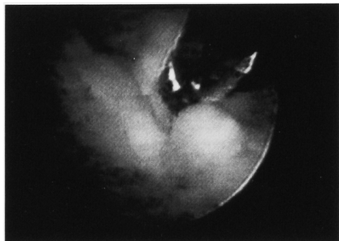
Fig. 2. Ureteroscopic view of the lesion in the right ureter.