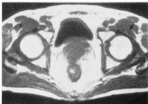
Fig. 1. MRI: T1 weighted image: The prostate gland is asymmetrically enlarged (5×4×7 cm) and is displaced by tumor which shows isosignal as muscle. The planes between the tumor, the bladder base and rectum cannot be clearly defined.