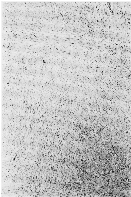
Fig. 2. 病理組織標本

術後経過: 術後におこなったリンパ造影, 腹部 CT スキャン, 肝スキャン, 骨スキャンでは転移は認められない. 術前に認められた LDH の高値は術後正常に復した. 再発予防を目的として, 術後20日目より右鼠径部に合計 5,000 rad の放射線照射をおこなった. 現在, 術後12カ月経過観察中であるが再発転移の徴候は認められない.