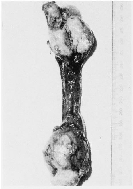
Fig. 1. 摘出標本

組織学的所見: 束状あるいは storiform pattern に配列する多形性の紡錘形細胞から成り, 核異型が強く, 異型核分裂を一部に認め (Fig. 2), 一部には巨細胞の出現を認める (Fig. 3). さらに PAP 法で抗ミオシン, 抗ミオグロビン血清で染色をおこなったが, 明確な陽性所見なく, 悪性線維性組織球腫と診断した. 炎症性細胞浸潤や粘液腫状の部位は認めない.