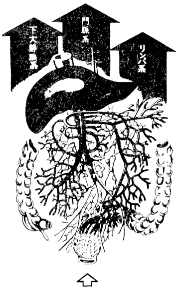
↑ フトラフルズボ スボS 3つの吸収経路