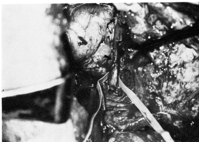
Fig. 3. LD 23; Stenotic site of ureter indicated by the arrow.

膀胱内出血は4例に経験した。LD 1は術直後より高度の血尿が続いたが頻回に膀胱洗浄をおこない消失した。出血原因としては移植尿管断端部の止血不全