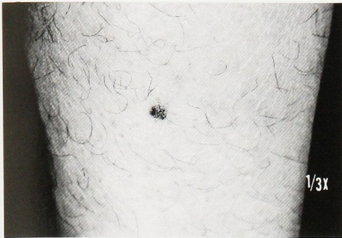
Fig. 1. A purplish 5×4 mm skin tumor was found on the left leg.