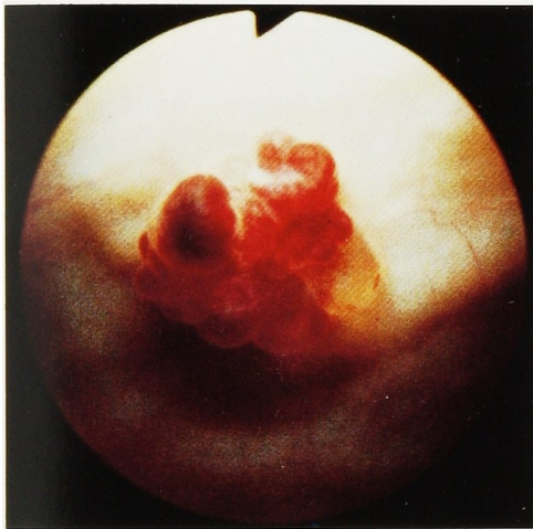
Fig. 2. Cystoscopy revealed a tumor of rice grain size on the right lateral wall of the urinary bladder. The tumor was multi-lobulated and variegated red-purple in color.