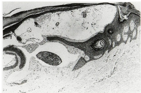
Fig. 5. Hyperkeratosis and acanthosis are present. Greatly dilated capillaries are seen in the upper dermis (H&E stain, reduced from ×40).