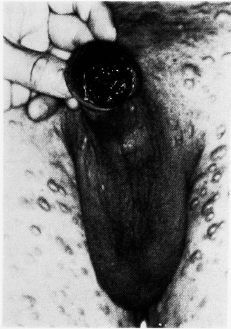
Fig. 2. 亀頭部の悪性黒色腫