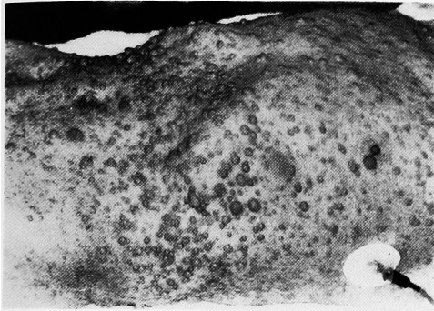
Fig. 1. レックリングハウゼン病