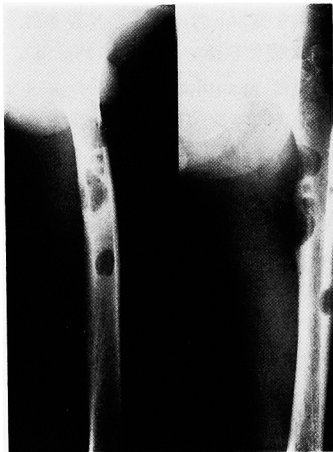
Fig. 3. Case 2, Left femoral metastasis

であった。術後より IFN- \alpha , UFT を併発し、外来にて経過観察した。しかし 1 カ月後の頭部 CT スキャンでは、手術部の血腫を認め再手術を施行した。さらにその後、再度局所に脳血腫を認め、同年 4 月 12 日死亡した。