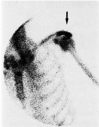
Fig. 1. Case 1, Bone scintigram shows abnormal uptake at the scapula.