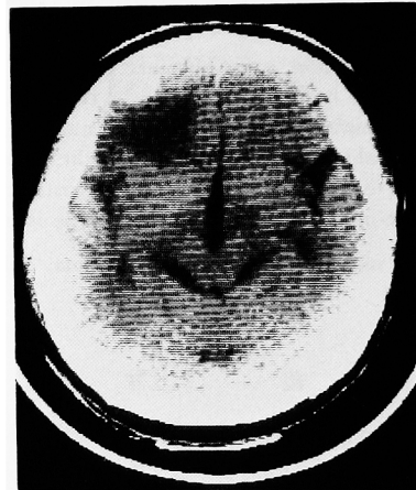
Fig. 5. Case 4, CT scan reveals brain tumor.

症例 4・55 歳男性。1980 年他院にて、右側腎細胞癌にて、腎摘出術を施行した。1985 年 7 月より不穏状態に陥り来院した。頭部 CT スキャンにて、単発性の脳転移巣を認めた (Fig. 5)。11 月開頭術にて、腫瘍を切除した。病理所見は granular cell subtype, grade 3 であった。術後経過良好にて退院し、外来にて経過観察した。2 カ月後の CT スキャンにて、血腫を認め、これを再度摘出した。その後さらに他の脳転移や手術部位よりの出血を認め、3 月 1 日死亡した。