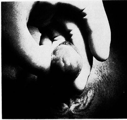
Fig. 1. 外尿道口を中心に発赤を認める