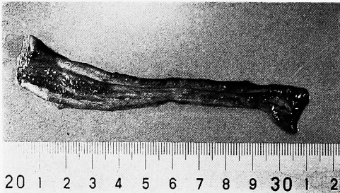
Fig. 3. 摘出尿道；尿道粘膜には肉眼上，腫瘍の存在を認めない。

中心に，自発痛，分泌物のない発赤した皮疹を認める (Fig. 1)。腹部には，膀胱全摘除術後の術創およびストーマを認める。心肺理学所見には特に異常を認めることができなかった。表在リンパ節も触知せず。