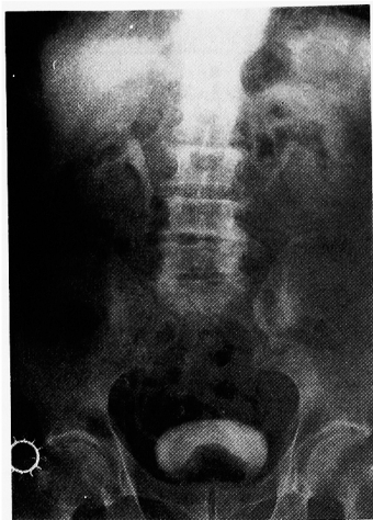
Fig. 2. 症例1 (82歳, 前立腺肥大症) の DIP 15分像