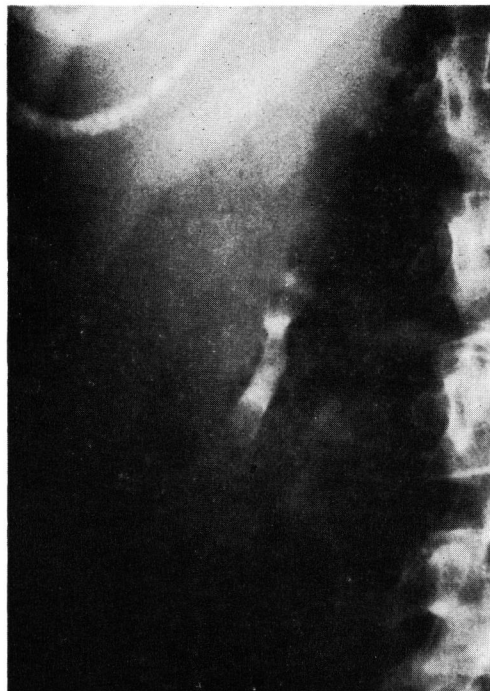
Fig. 3 IVP 立位像 (右腎)