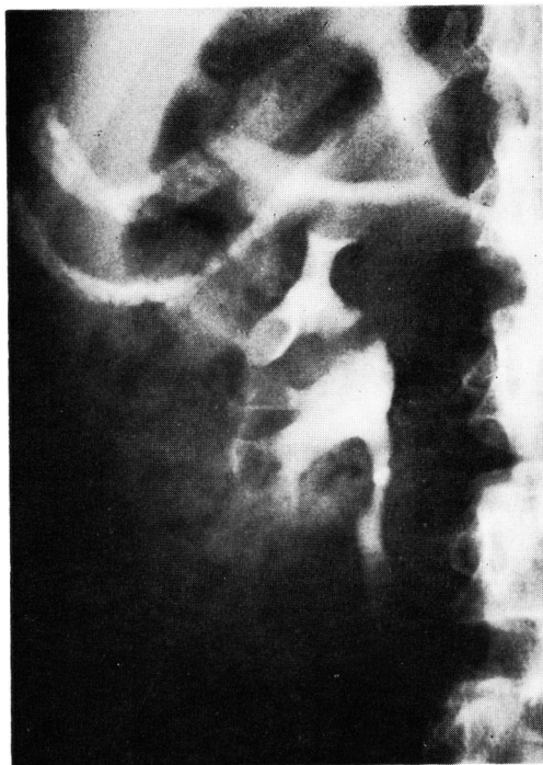
Fig. 1 IVP 7分後 (右腎)