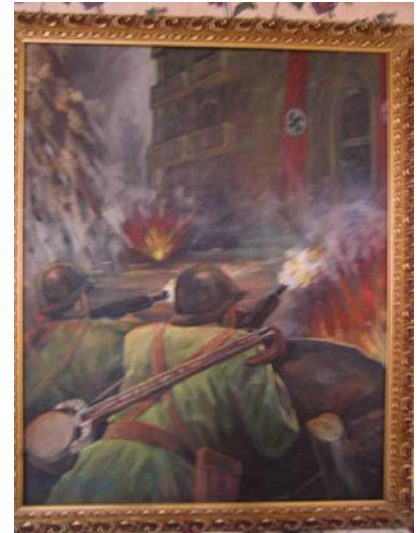
《ナチスと戦うウイグル族兵士の絵》

昼食を食べるために入ったレストランで面白い物を見つけた。その壁にはナチス軍と戦っている兵士の絵が掛かっていた。私が「なぜこんな絵が、ここに掛かっているのだろうか」と不思議そうにながめっていると、通訳が「これは第2次大戦にソ連兵として参加し、ナチスと戦ったウイグル族の絵です。戦っているウイグル族の兵士たちが、ラウップ(ウイグル族の民族楽器)を背負っているでしょう」と話してくれた。第2次大戦当時、イリ地方の若者たちはソ連兵として西部戦線で戦ったのだという。したがってウイグル族は、現在でも中国人という意識が少なく、カザフスタン・ウズベキスタン・キルギスタンなどの国の人々との交流が強いのだという。たしかによくよく地図を見てみると、イリ地方はカザフスタンと草原続きで、この地の住民はカザフスタンとの往来には障害がないように思われた。次回にはこの地方に足を運び、この地形を見て、ナチスと戦ったという老兵士を見つけインタビューしてみたいと思う。