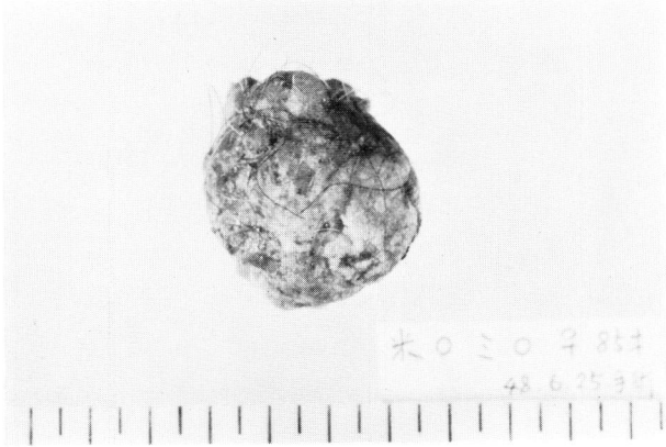
Fig. 2. 摘出標本