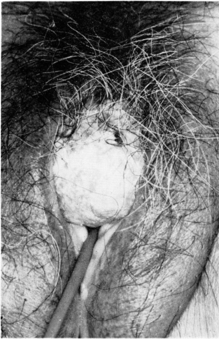
Fig. 1. 外陰部所見